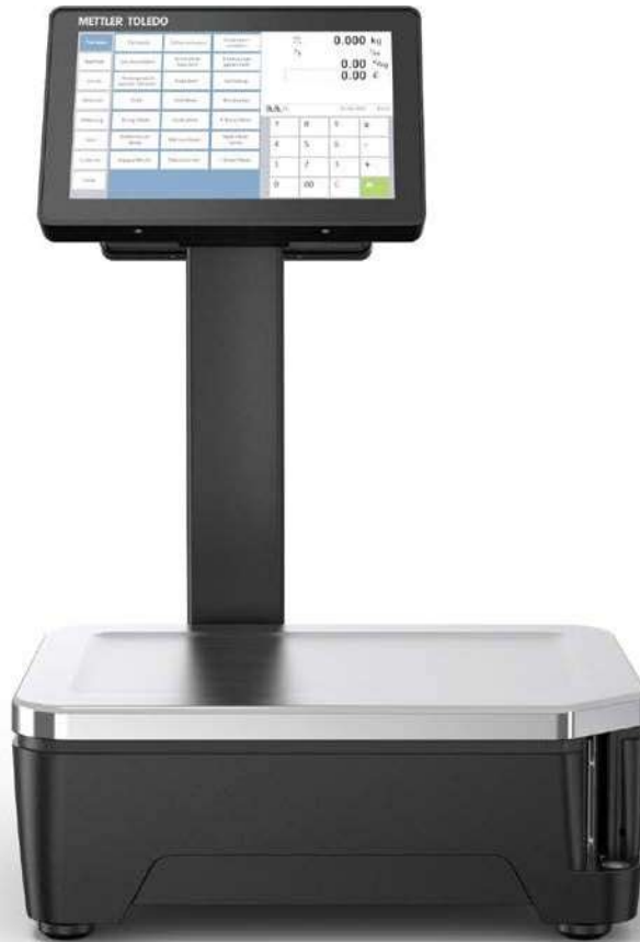
FreshBase Tower Waage

Bewährte Funktionalität, überzeugendes Preis-Leistungs-Verhältnis: FreshBase Line ist die neue Waagenfamilie für Lebensmitteleinzelhändler, die in die Leistungsklasse des Wiegens mit Touch-Komfort einsteigen möchten.